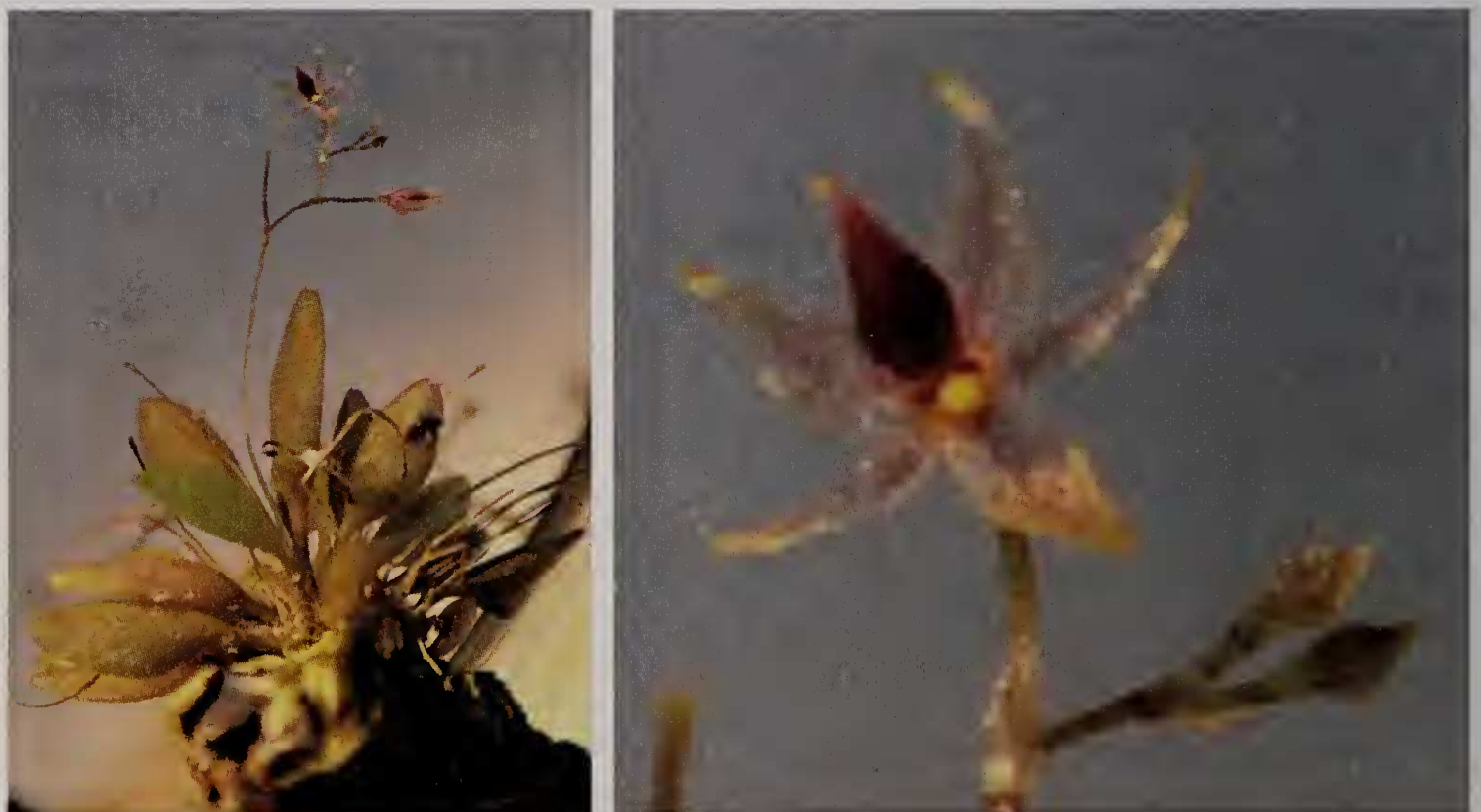
Fig. 3 : Platystele crotaloglossa

Plante cespiteuse de 10 mm de diamètre, avec 20-30 feuilles ; feuille à pseudo-pétiole long de 2 mm, limbe foliaire orbiculaire elliptique, 4 \times 2,2 mm, tridenté à l'apex (les marges latérales sont denticulées) ; inflorescence courte mais toutefois plus longue que la feuille, 12 mm de longueur, produisant 3-6 fleurs ; fleur rose à labelle rouge ; sépale dorsal triangulaire, 1,5 \times 0,4 mm, acuminé, les latéraux obliquement orbiculaires avec un apex obliquement aciculaire, 1,3 \times 0,3 mm à la base ; pétales linéaires, obliquement acuminés, la base légèrement orbiculaire, 1,4 \times 0,2 mm ; labelle rhombique, 1 \times 0,2 mm à la base, apex crotaliforme ; colonne étroite, trilobée, 0,1 mm de largeur en partie apicale. Fig. 2b & 3.